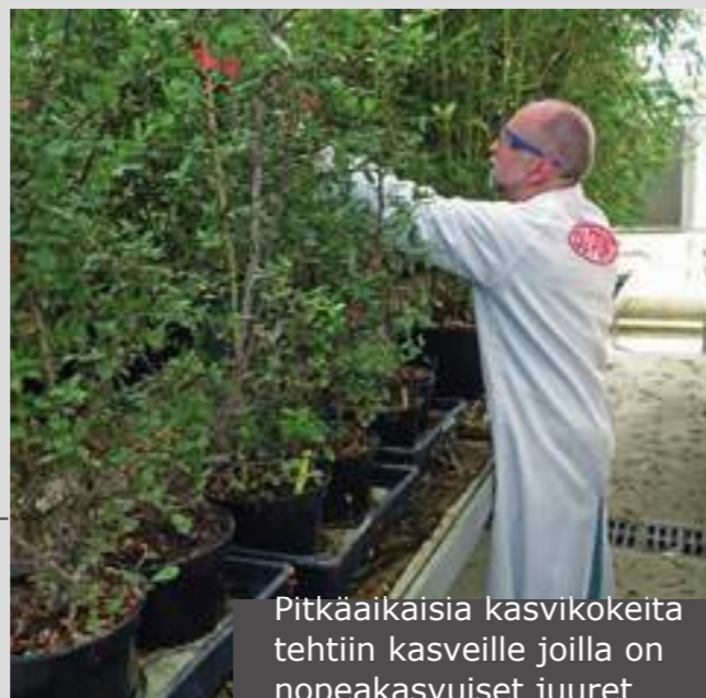
Pitkäaikaisia kasvikoikeita tehtiin kasveille joilla on nopeakasvuiset juuret

Helppo asentaa laajan valikoiman suurien mittojen kautta (1-5,2 m leveä x 100 m pitkä) jotta liitosten määrä vähenee.