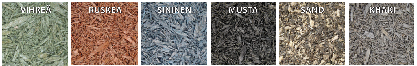
Ecosurface standardiväri vaihtoehdot