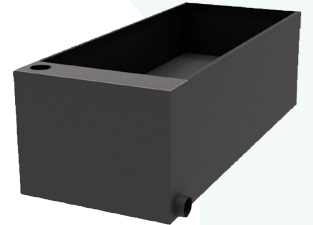
Oasis™ kaupunkiviihtyvyyttä lisäävä elementti